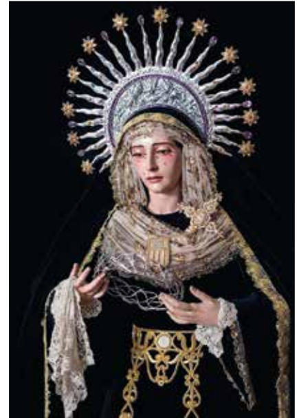
Virgen de la Merced.

procesionales, el juego de insignias, la plata para el culto, la pintura, los retablos cerámicos, la visión fotográfica de la cofradía y sus imágenes o el riquísimo patrimonio musical de la corporación.