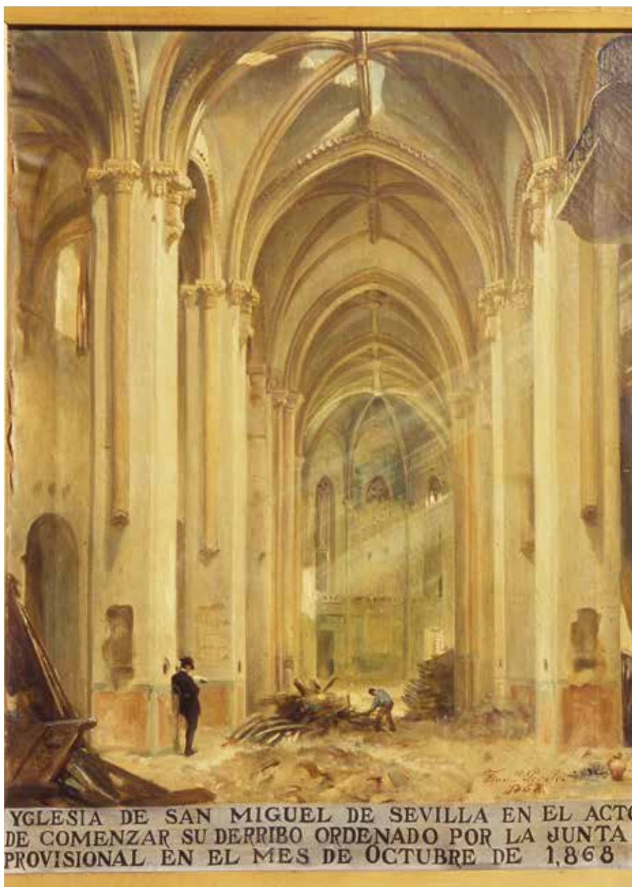
Derribo de la iglesia de San Miguel, que fuera sede de la hermandad en el siglo XIX, óleo sobre lienzo, colección particular.