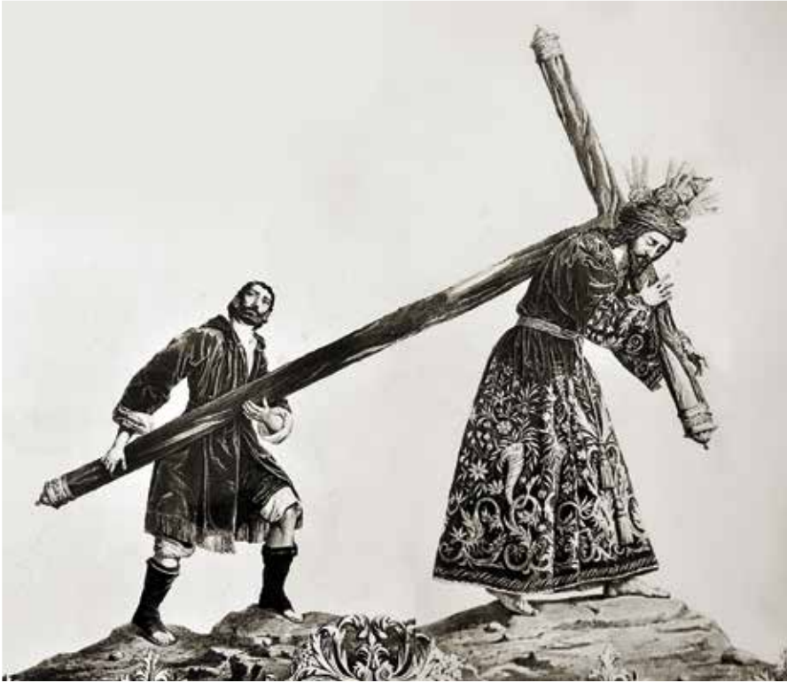
Pasión con Cireneo en un grabado del siglo XIX. Archivo de la Hermandad.