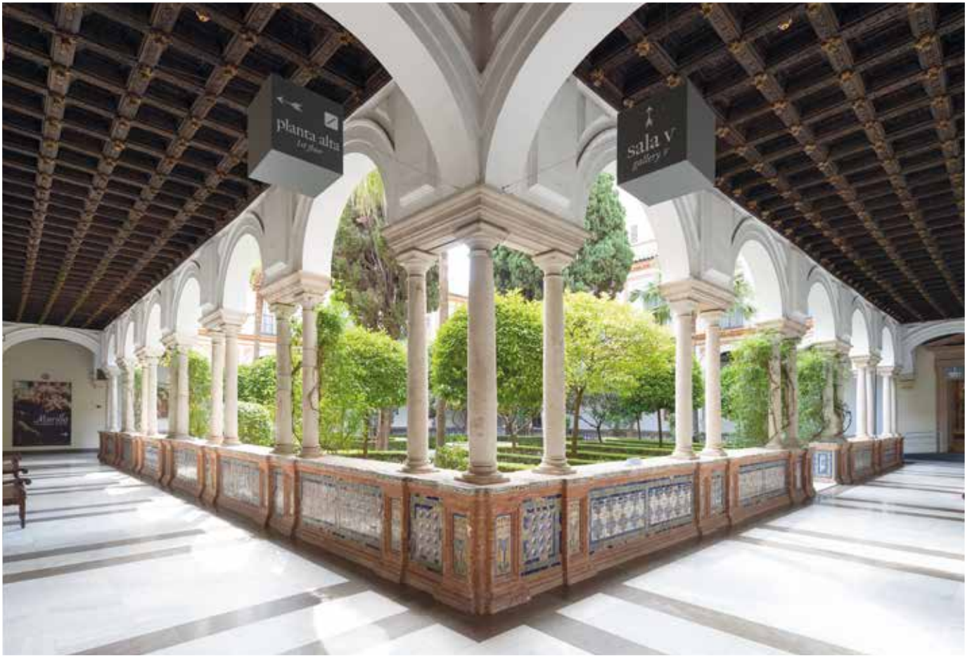
Claustro del Convento de la Merced, actual museo de Bellas Artes, sede fundacional de la hermandad.