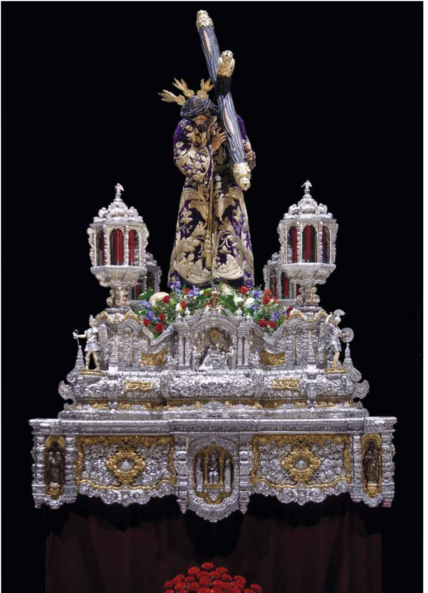
Pasión en su paso de plata, obra de Cayetano González.