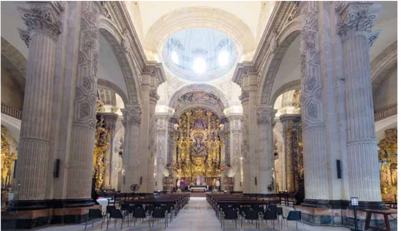
Interior del templo del divino Salvador, actual sede de la corporación.