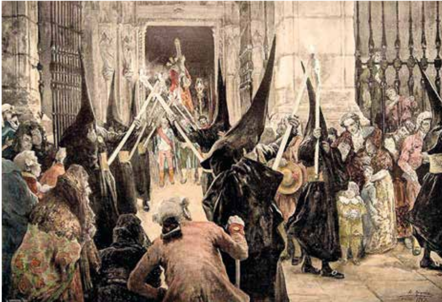
Grabado de la salida procesional de la cofradía en el siglo XIX.