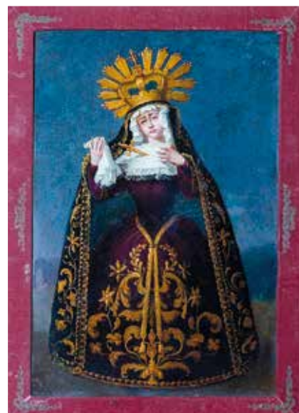
Guardas del antiguo Libro de Reglas, hacia 1850.