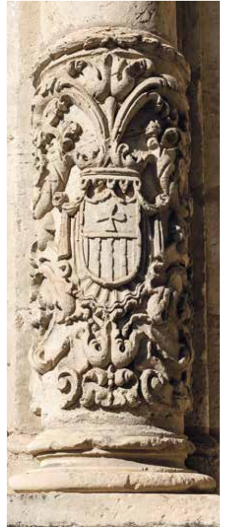
Detalle del escudo de la Merced en el acceso actual al museo de Bellas Artes.